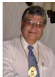
Mensaje del Presidente del Skål Club de Montevideo

El Turismo es una industria que, anticipándose a los deseos de sus clientes, logra que éstos cumplan sus sueños, conozcan pueblos, culturas y países diferentes, fomentando así la concordia y la tolerancia.