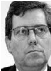
Mensaje del Presidente del Comité Organizador del XXIV Congreso Latinoamericano de Clubes Skål.