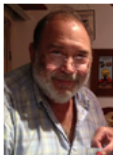
Mensaje del Presidente del Comité Nacional de los Skål Clubs del Uruguay